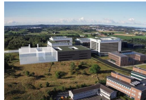
Helle E-bygger.

Standardisering på alle nivåer gir berikelse og nytteverdi